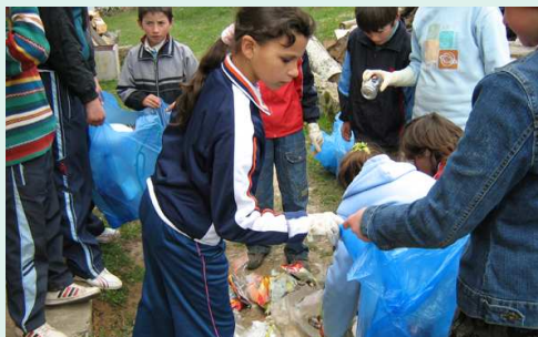
Les enfants de l'école apprennent à ramasser les déchets dans des sacs pour ensuite les brûler

Cette année, du fait des inondations dans tout le pays, les familles n'ont pas pu libérer les enfants en cette période pour venir passer quelques jours de vacances en France. Cela ira mieux l'an prochain.