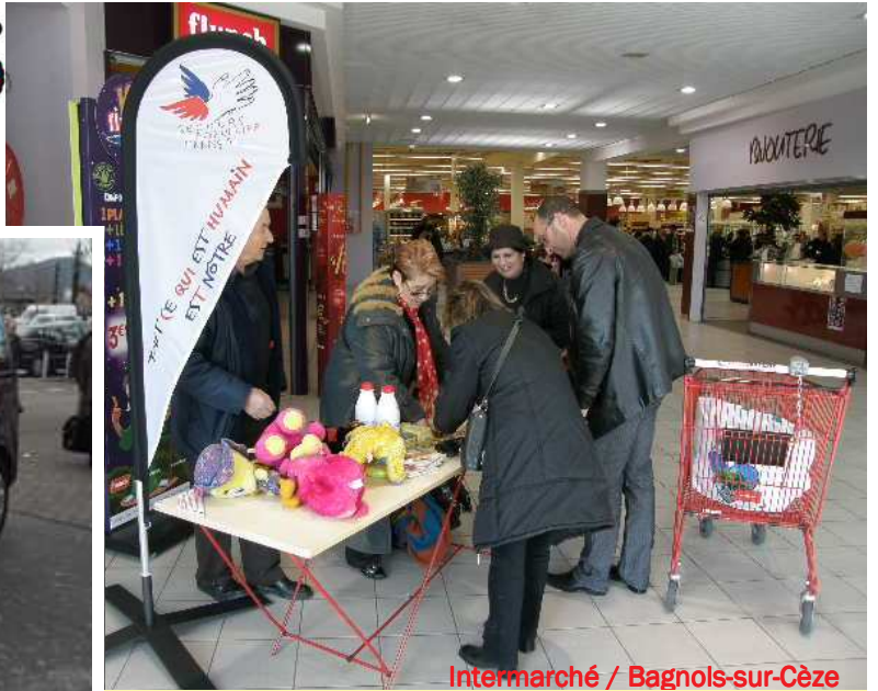
Intermarché / Bagnols-sur-Cèze