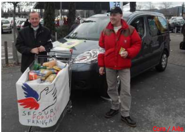
Cora / Alès

C'est parti ! Début de campagne parfois difficile mais les bénévoles de tout le département s'investissent pour le Don'Actions.